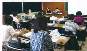
大事なお子さんを預かる前に

※8月26日(水)に予定しておりました講習「小児看護の基礎知識」-普通救命講習III-は消防署のコロナ感染対策の為、開催を見合わせました。