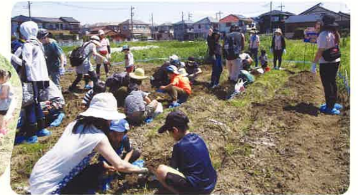
文章：アドバイザー 高橋啓子