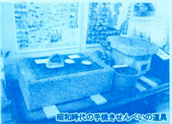
昭和時代の手焼きせんべいの道具