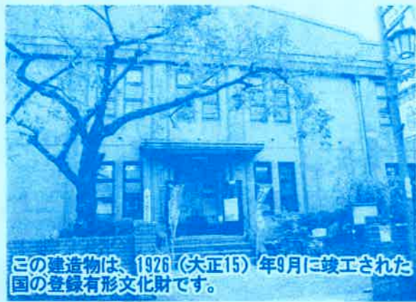
この建造物は、1926(大正15)年9月に竣工された国の登録有形文化財です。

郷土の民俗資料や歴史資料など縄文時代~昭和までの収蔵品が展示・保管されています。