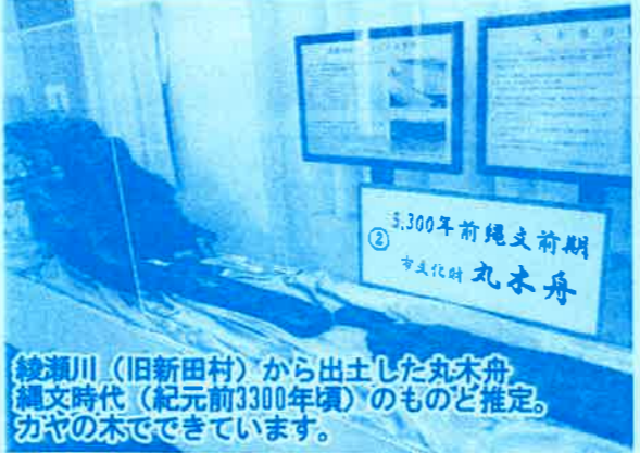
綾瀬川(旧新田村)から出土した丸木舟。縄文時代(紀元前3300年頃)のものど推定。舟の木の皮でできています。